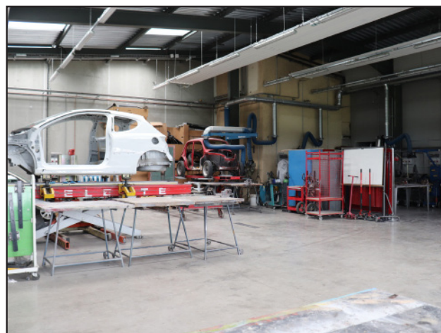
Atelier carrosserie - IFP 43

Formation gratuite en apprentissage et financée par les OPCO (Opérateurs de compétences)